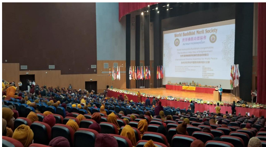
Photo: Hội trường Lễ Phật Thành Đạo tại Cung Văn Hóa

Chương trình được bắt đầu bằng niệm Bốn Sư Phật ba lần, rồi chiếu phim về lịch sử Đức Phật Thích Ca, lịch sử Phật giáo tại Ấn Độ truyền bá sang các nước khác, cuộc đời các pháp sư Huyền Trang, Pháp Hiền, Nghĩa Tịnh... cống hiến cho Phật giáo và đến nay thế kỷ XXI, Phật giáo ngày càng phát triển. Hiện nay, nhiều nước trên thế giới về Bồ-đề-đạo-tràng xây dựng đạo tràng, học viện, trường thiên, cơ sở từ thiện... và Bồ-đề-đạo-tràng, nơi Đức Phật giác ngộ, đã trở thành trung tâm Phật giáo cho toàn cầu thế giới.