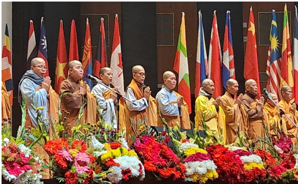
Photo: Tăng Ni Việt Nam tụng Đại Bi và Bát Nhã cúng dường