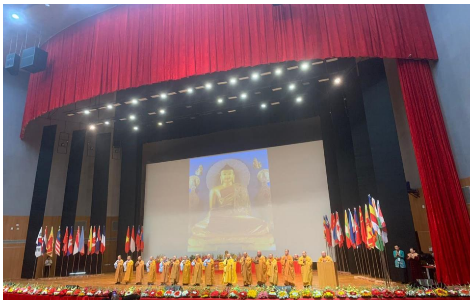
Photo: Toàn cảnh Tăng Ni Việt Nam tụng kinh

Này hỡi người thợ làm nhà! Người đã bị bắt gặp. Người không còn cất nhà nữa. Tất cả rui mè của người đã gãy. Cây đòn dông của người cũng bị phá tan. Tâm của Như Lai đã thành đạt trạng thái vô lậu. Mọi ái dục đã hoàn toàn chấm dứt. (Kinh Pháp Cú) 4